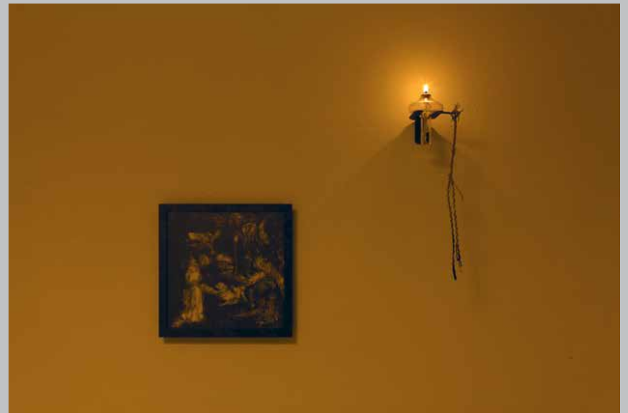
„Pealkirjata Nr. 1“ ja „Pealkirjata“, 2018.

СЭМ СМИТ (род. 1980, Сидней, Австралия; живет и работает в Великобритании) – художник и режиссер. В своих работах над фильмами, видеоинсталляциями и перформансом объединяет кинематограф, геологию и архитектуру, чтобы переосмыслить современные методы взаимодействия с материальной средой. Работы Смита демонстрируются на многих площадках по всему миру: Международный Роттердамский кинофестиваль; Готландский художественный музей (Швеция); галерея Whitechapel (Лондон), Московский Международный Фестиваль Экспериментального Кино; фестиваль Les Rencontres Internationales (Париж и Берлин); Кунстхал Шарлоттенборг (Копенгаген); галерея The Telfer Gallery на фестивале Glasgow International (2016); центр Centro de Artes Visuais (Португалия); Австралийский Центр Движущегося изображения (ACMI, Мельбурн); Институт современного искусства KW (Берлин); галерея Art Gallery of NSW (Сидней); Институт современного Искусства (ICA, Лондон) и других.