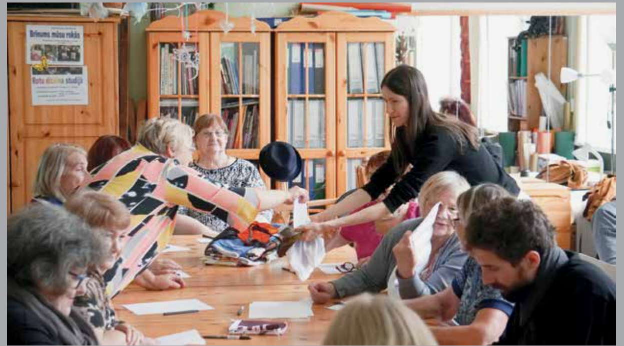
«Выезд в Куусамо. Шахта Юомасуо», 2019.