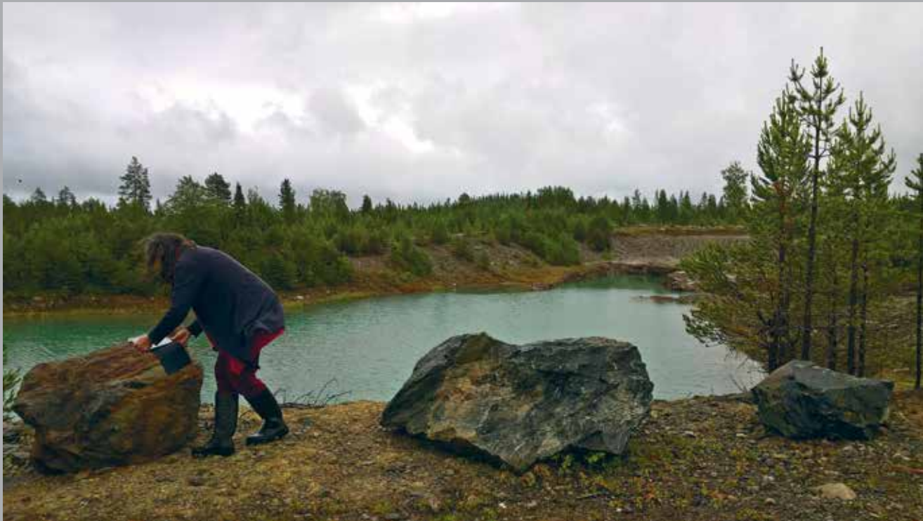
„Teiste haavad“, 2018. Töötuba Riia Rahvusvahelisel Kaasaegse Kunsti Biennaalil.