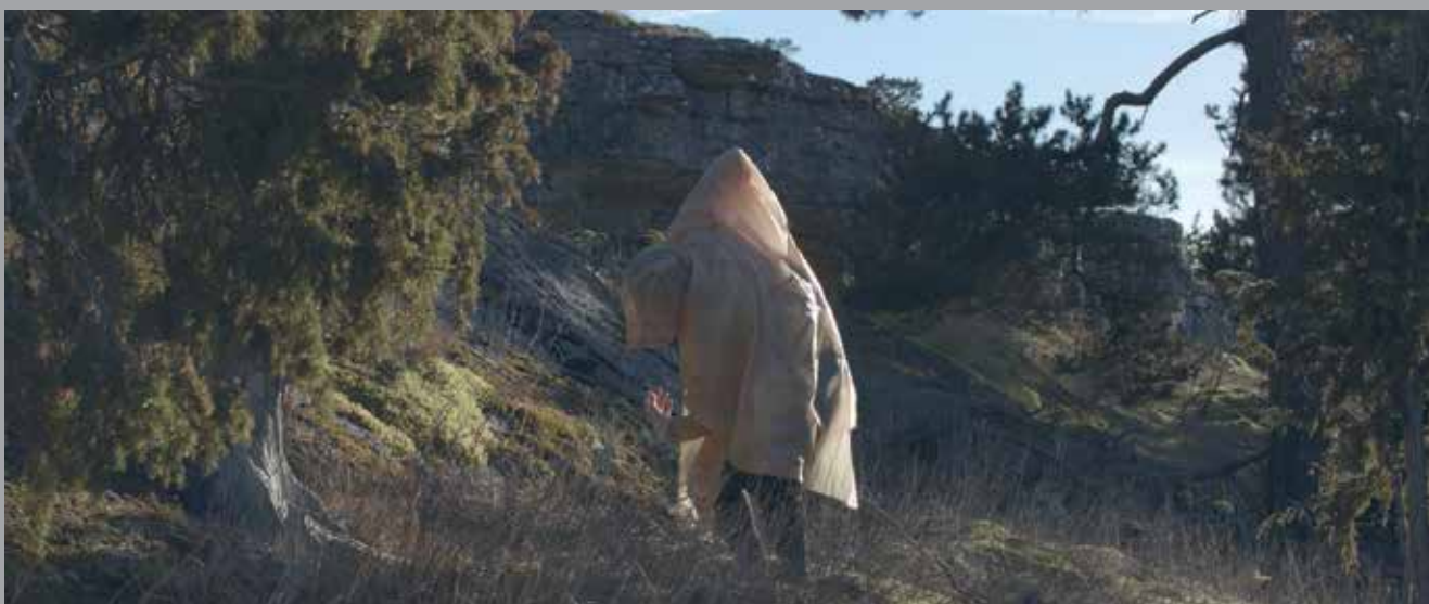
„Kivijastute koreograafiad“, 2018. Kaader videost. Kunstniku loal